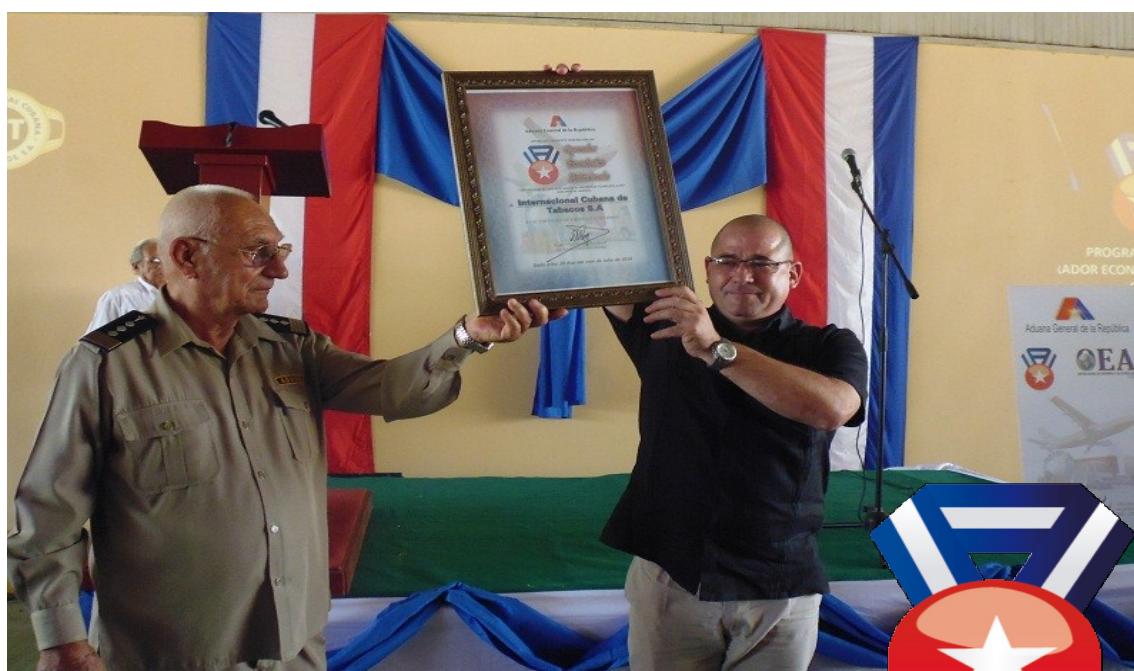
El jefe de la Aduana General de la República hizo entrega del Certificado de Operador Económico Autorizado (OEA) a la entidad Internacional Cubana de Tabacos S.A.

Teniendo en cuenta la trayectoria de cumplimiento de la normativa aduanera y de sus obligaciones tributarias, y la seguridad de su cadena logística, la Aduana General de la República decidió escoger a la entidad Internacional Cubana de Tabacos SA.