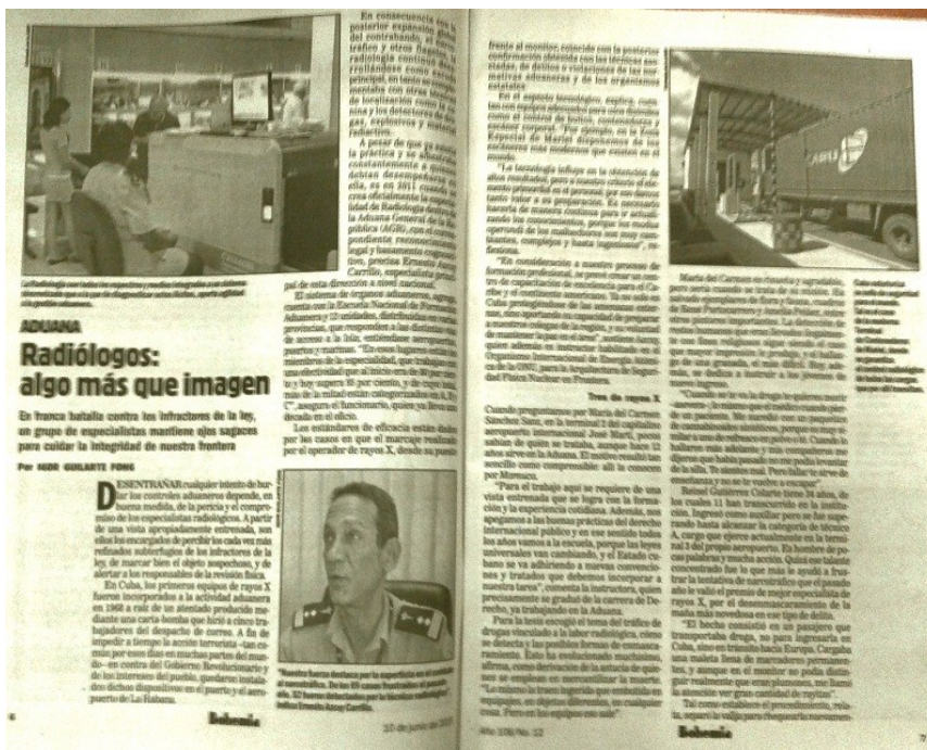
Trabajo publicado en la Revista Bohemia

En el marco de esta fecha, para informar al público sobre los resultados alcanzados por la especialidad de Radiología en la Aduana, se logró ampliar la labor de divulgación en los distintos territorios del país, a través de los medios de comunicación masiva: prensa pla-