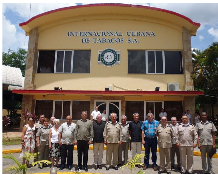
En el Acto de Certificación de la entidad Internacional Cubana de Tabacos S.A.

A partir de la certificación de Internacional Cubana de Tabacos S.A como Operador Económico Autorizado, han mostrado interés en pertenecer a este programa las em-