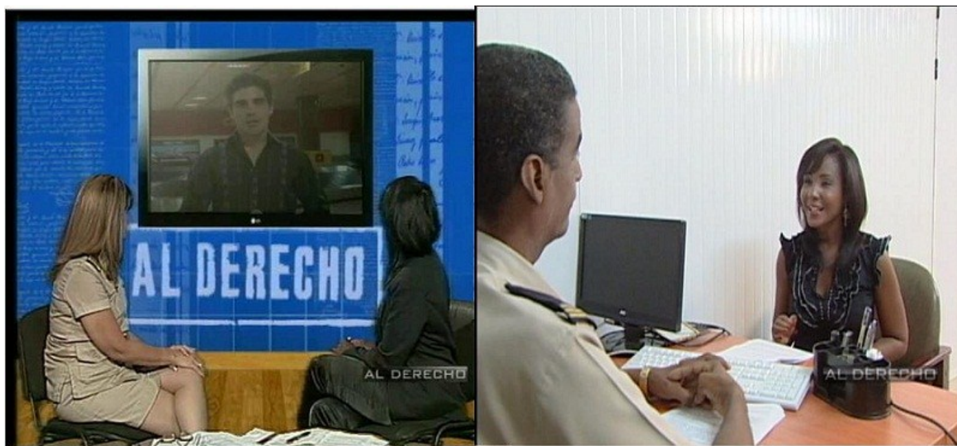
Programa “Al Derecho” en los años 2012 y 2013

Desde finales del 2013 la Aduana General de la República incorporó su presencia en las redes sociales (Facebook, Twitter, Google+, YouTube, entre otras). En el caso de la página de la Aduana en Facebook, esta ha logrado mayor interacción con el público debido a que no solo publica noticias e informaciones, sino que también responden y aclaran dudas a los usuarios que lo soli-