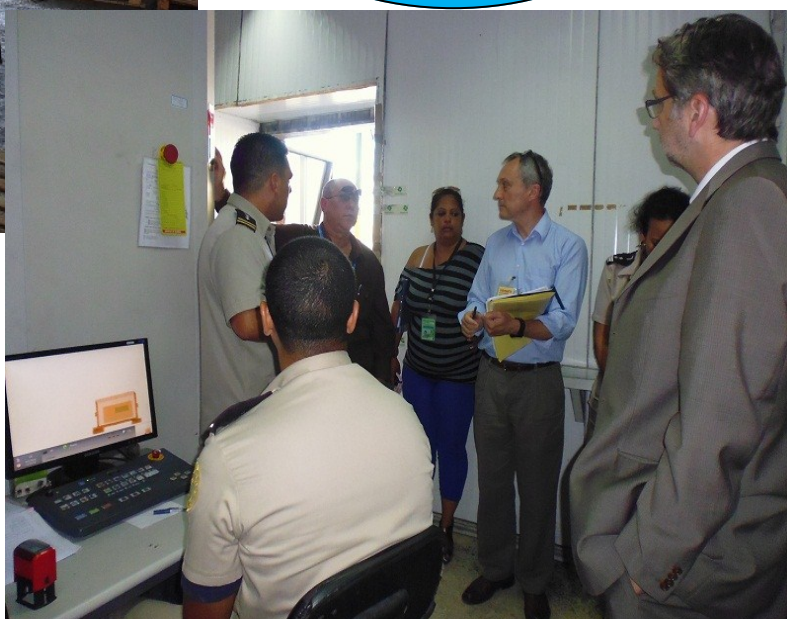
Los expertos en la visita a la Aduana de Carga Internacional

“han logrado unir positivamente tres componentes fundamentales: información, análisis y gestión de riesgos.”