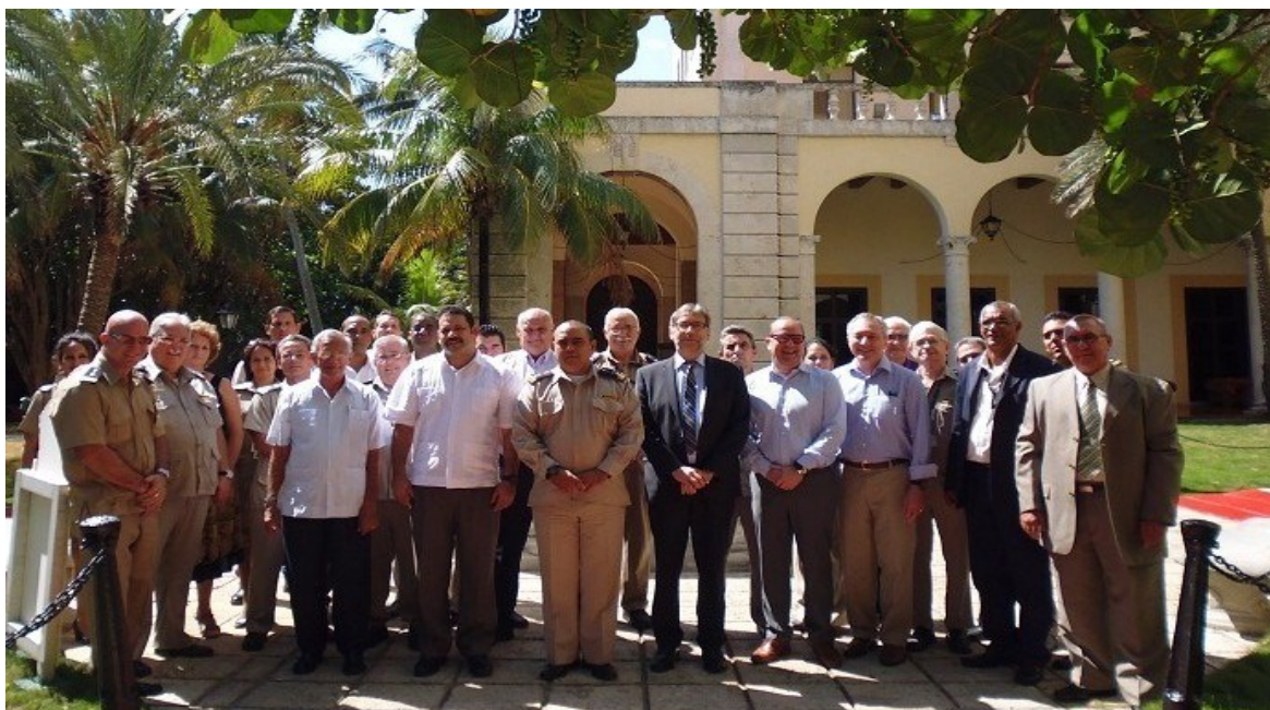
Foto oficial de los encuentros realizados entre los expertos del Programa de Control de Contenedores y directivos, especialistas de la Aduana y otros ministerios

Los cuatro expertos mantuvieron encuentros con directivos y especialistas de la Aduana y otros ministerios, en los cuales expusieron sobre las particularidades generales del Proyecto, el cual tiene entre sus objetivos la facilitación del comercio y la mejora en la cooperación regional e internacional.