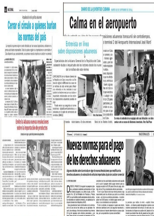
Algunos trabajos periodísticos sobre las regulaciones aduaneras en diferentes años

Asimismo, se tuvo en cuenta la necesidad de rediseñar el sitio Web de la Aduana en Internet, el cual se mantiene en constante actualización para mejorar su accesibilidad y la información publicada. Con su nuevo rediseño se elevó el número de accesos, visitas, descargas y facilitó la navegación a los usuarios desde sus móviles y tabletas, al igual que se crearon las condiciones técnicas necesarias para lograr en un futuro un Sitio Web más interactivo.