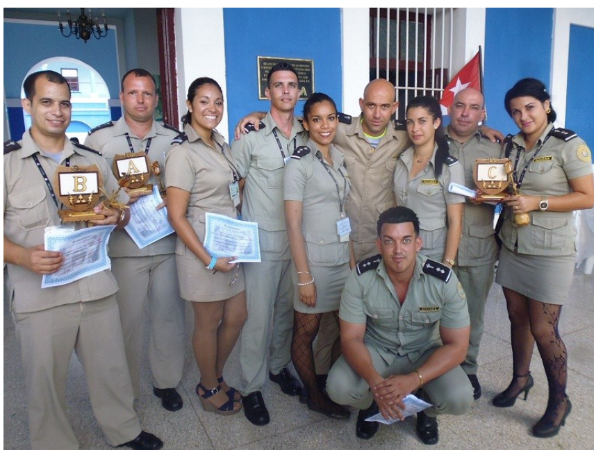
Oficiales de Aduana con sus diplomas de Categorización

Además, se realizó el primer curso de oficiales de Aduana en función del control de salida en el canal aéreo, habilitándose 136 oficiales para la manipulación de 25 equipos detectores de explosivos, instalados y en funcionamiento