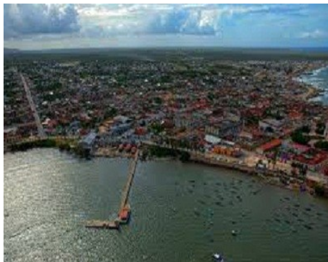
Puerto de Gibara

Gibara continuó como Aduana cabecera de Holguín hasta 1906, llegando incluso a proponerse que fuera ella la que costeara los gastos que ocasionara la conversión de Holguín en provincia, una vez que este territorio se separara de Santiago de Cuba, algo que no llegó a materializarse.