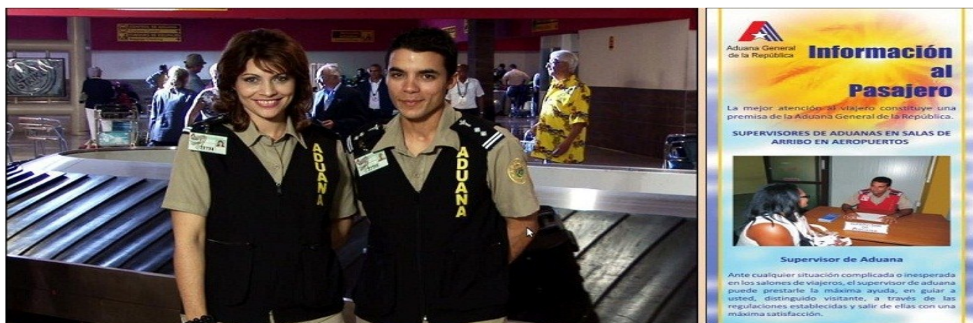
Video y suelto sobre la figura del Supervisor de Aduana, confeccionados en el año 2012

Dentro de este proceso se han detectado puntos fuertes y débiles que se han convertido en metas a trabajar. Un ejemplo de ello es el uso excesivo del lenguaje técnico en los trabajos de divulgación, aspecto en el que se